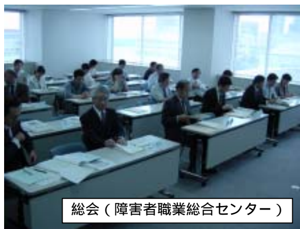
総会（障害者職業総合センター）