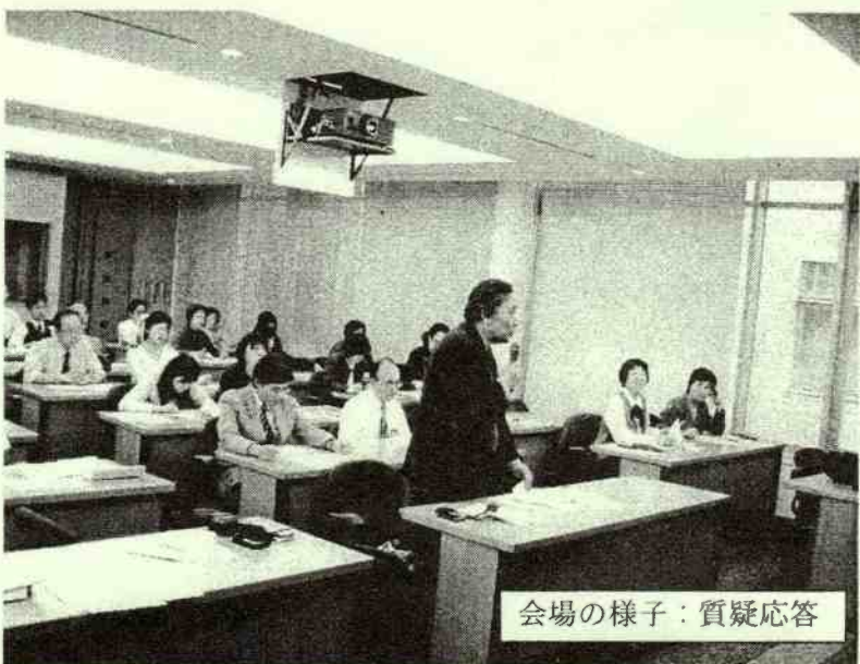
会場の様子：質疑応答